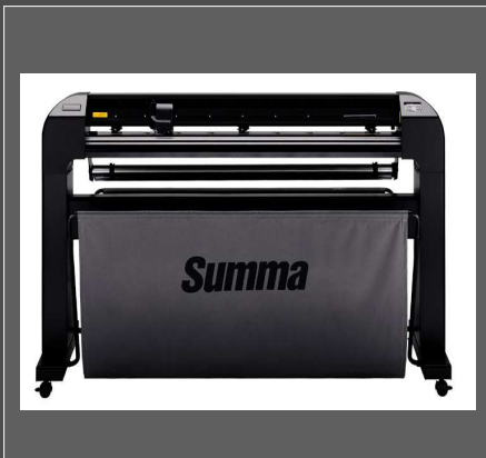
SUMMA S-CLASS S 120T – 2E